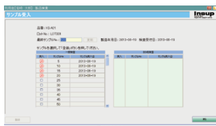
サンプル受入選択画面