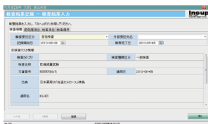
検査結果入力 基本情報画面